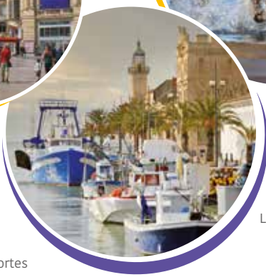
Le Grau du Roi